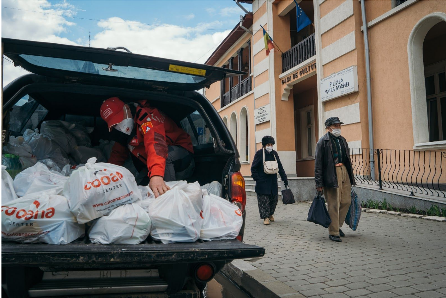
Un membru al echipei locale Salvamont încarcă alimente într-o mașină înainte de o livrare. A member of the local mountain patrol team loads food into a car before delivery.