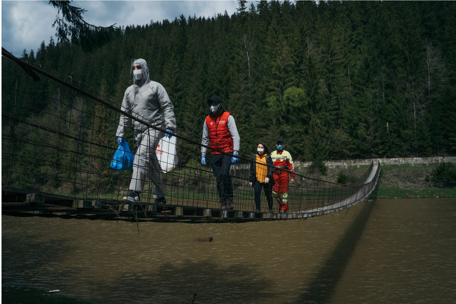
Organizația Tinerilor Dorneni s-a ocupat de coșuri de alimente pentru persoane nevoiașe și a dus alimente și la câteva case izolate la poalele muntelui. Organizația Tinerilor Dorneni, a local youth organization, took care of food baskets for people in need and took food to several isolated houses at the foot of the mountain.