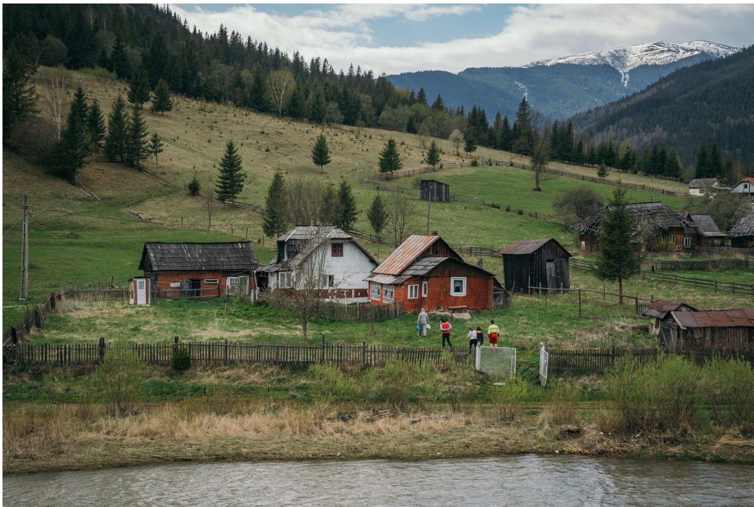
Un localnic îi conduce pe voluntarii din Vatra Dornei la casele persoanelor vulnerabile. A local leads the volunteers from Vatra Dornei to the homes of vulnerable people.