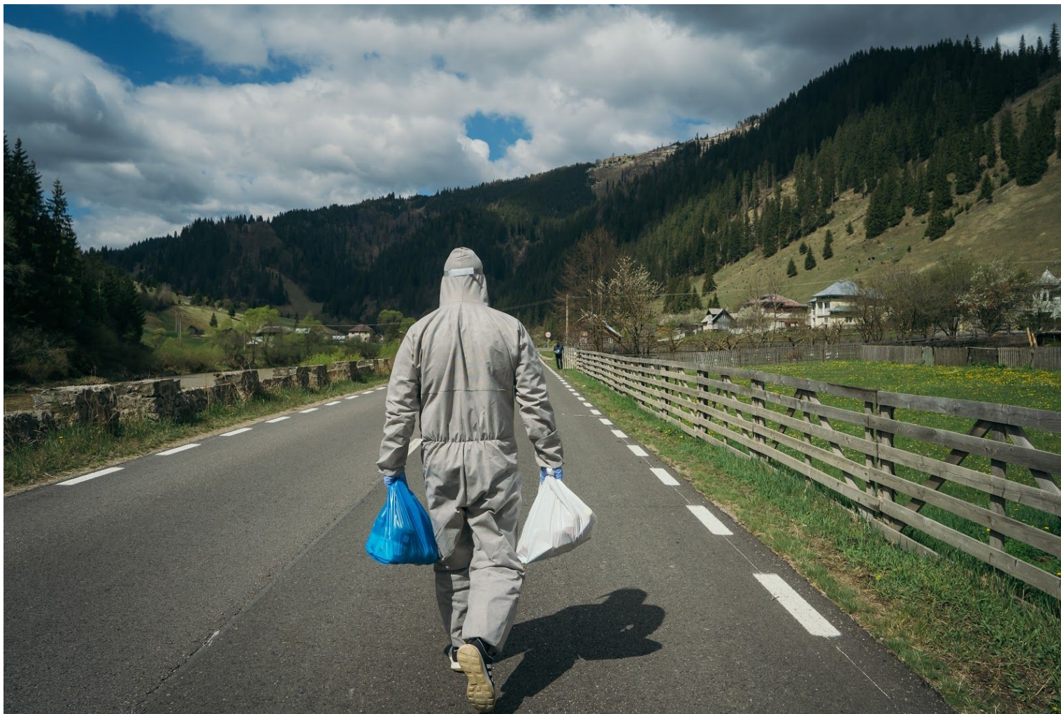
Un voluntar duce alimente la o familie dintr-un sat din zona Vatra Dornei. A volunteer carries food to a family in a village in the Vatra Dornei area.