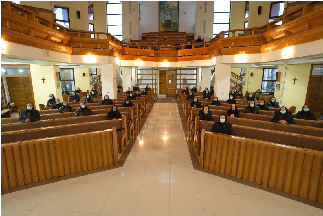
11. În comunitatea catolică din Huta Certeze, recomandările de distanțare socială au fost respectate cu sfințenie 11. In the Catholic community of Huta Certeze, the recommendations of social distance were sacredly observed.