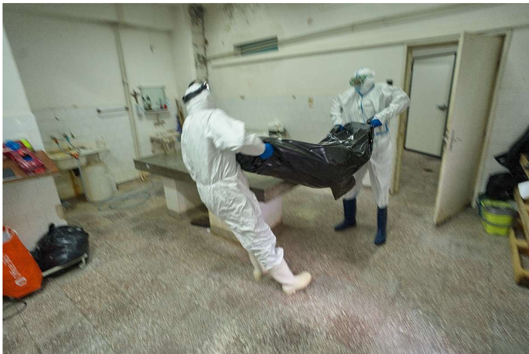
12. La morga spitalului din Negrești Oas, morgarii aduc un decedat, confirmat pozitiv cu coronavirus, pentru a fi recunoscut de aparținători. Ulterior, ei sunt sigilați în saci de plastic și inchiși în sicrie, apoi fiind predate familiei pentru înhumare.

12. At the morgue of the hospital in Negrești, Oas morgarii bring a deceased person, confirmed positive with coronavirus, to be recognized by their relatives. Later they are sealed in plastic bags and locked in coffins, then being handed over to the family for burial.