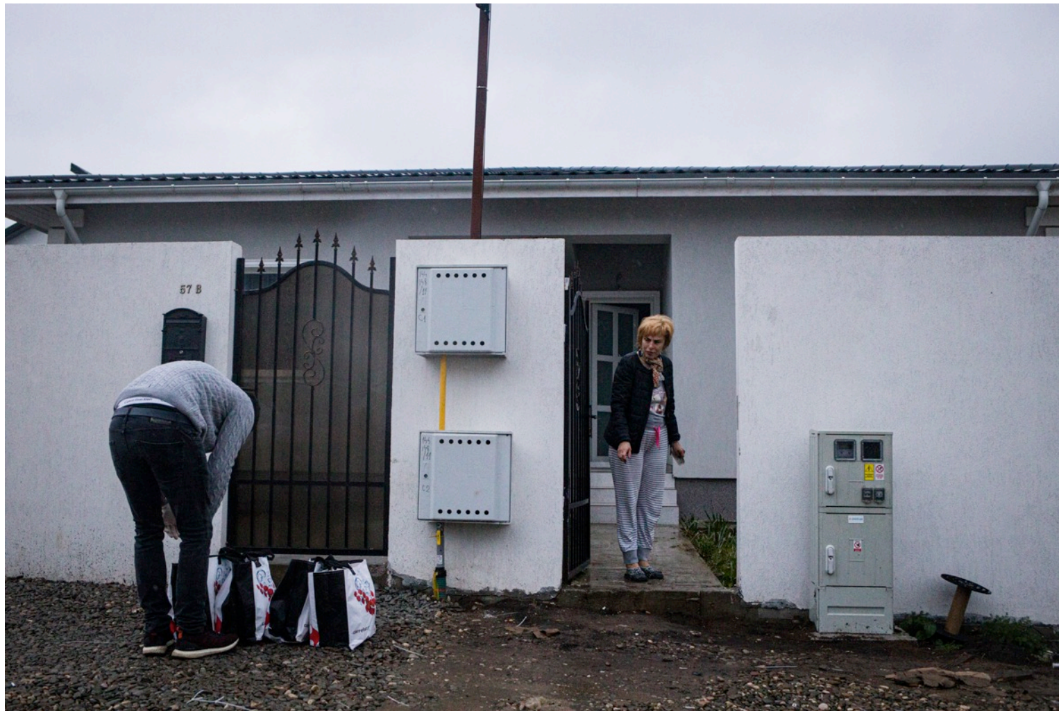
Un voluntar livrează cumpărăturile făcute pentru persoane care nu se pot deplasa de la domiciliu. Tunari, Ilfov, 23 martie 2020