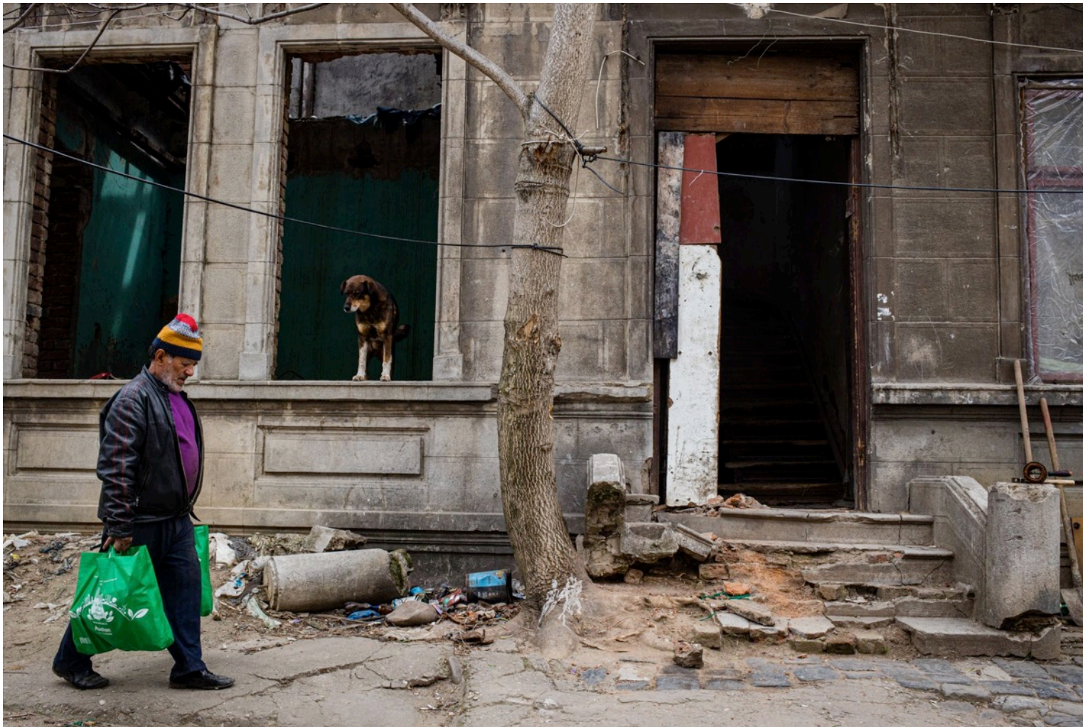
Unul dintre beneficiarii ONG-ului "Pe Stop" cară pachetele cu alimente primite în adăpostul temporar în care locuiește. București, 4 aprilie 2020