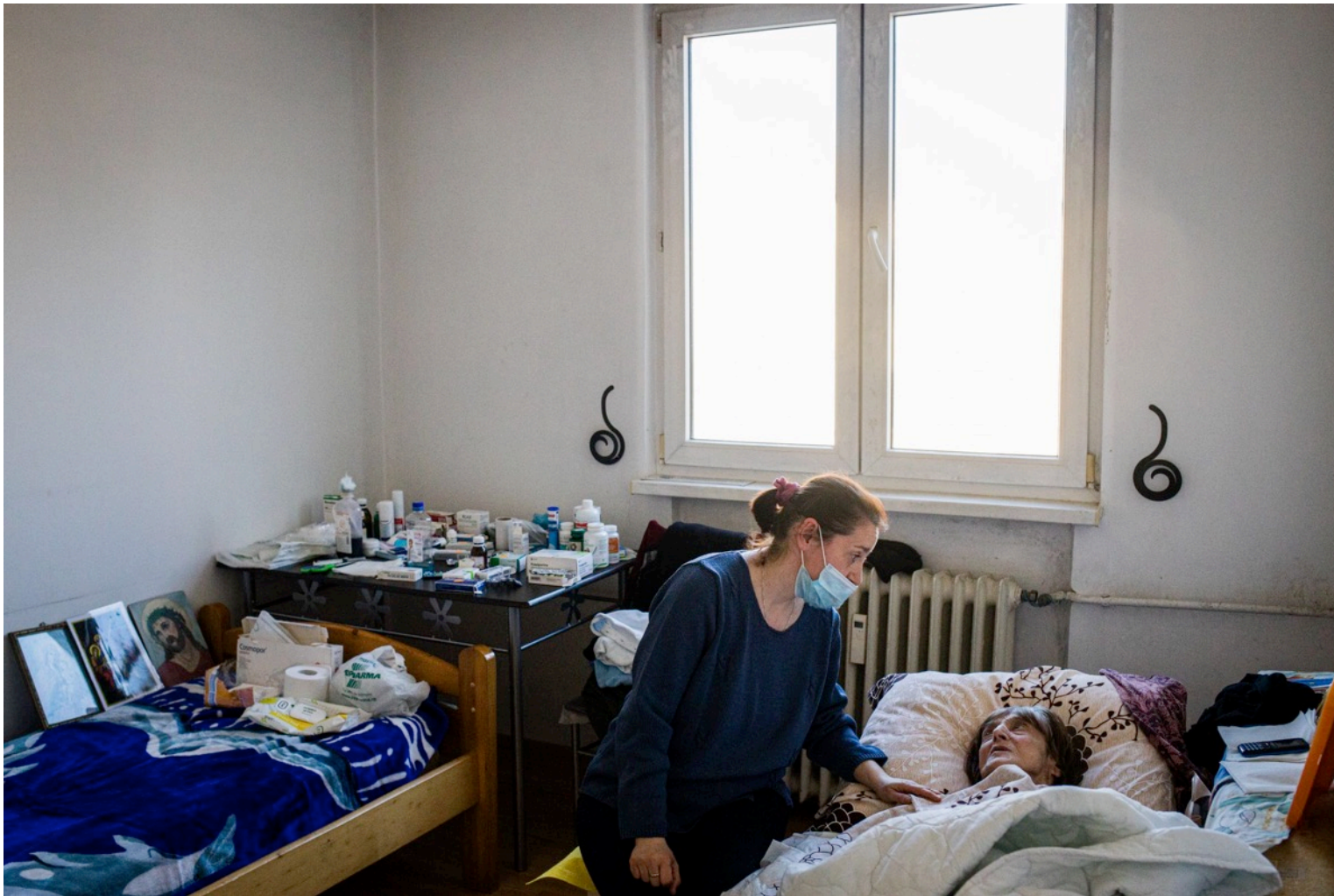
O asistentă socială în timpul unei vizite la una din persoanele în vârstă, care nu se poate deplasa. Piatra Neamț, 2 aprilie 2020