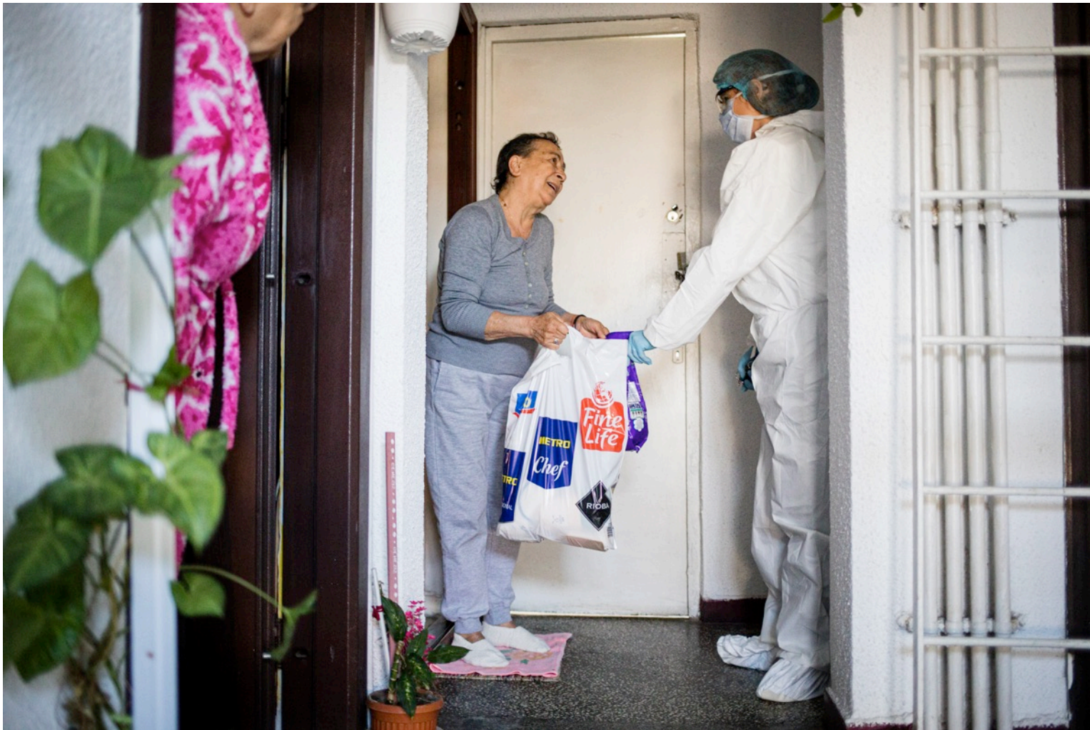
O angajată a Crucii Alb-Galbene livrează pachete cu alimente către persoanele în vârstă. București, 6 aprilie 2020